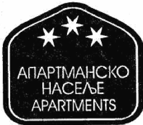
Prva kategorija kategorija